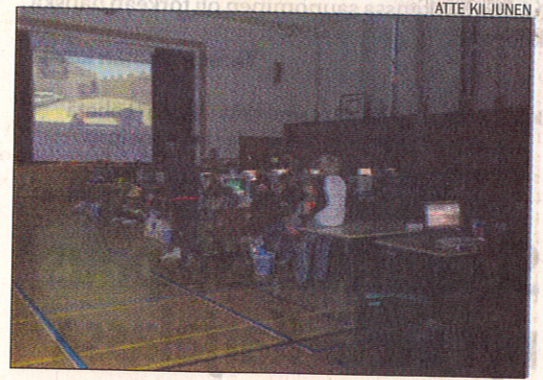
Lan-tapahtuman osallistujat seuraavat kilpailua valkokankaalta.

Vapaaehtoiset saavat ilmaisen konepaikan ja työ tehdään pienissä vuoroissa, jolloin jää aikaa hyvin myös pelaamiseen. Liput voi tilata Skynetin nettisivulta osoitteesta www.skynett.fi , josta löytää myös tapahtuman säännöt ja muuta tarpeellista tietoa.